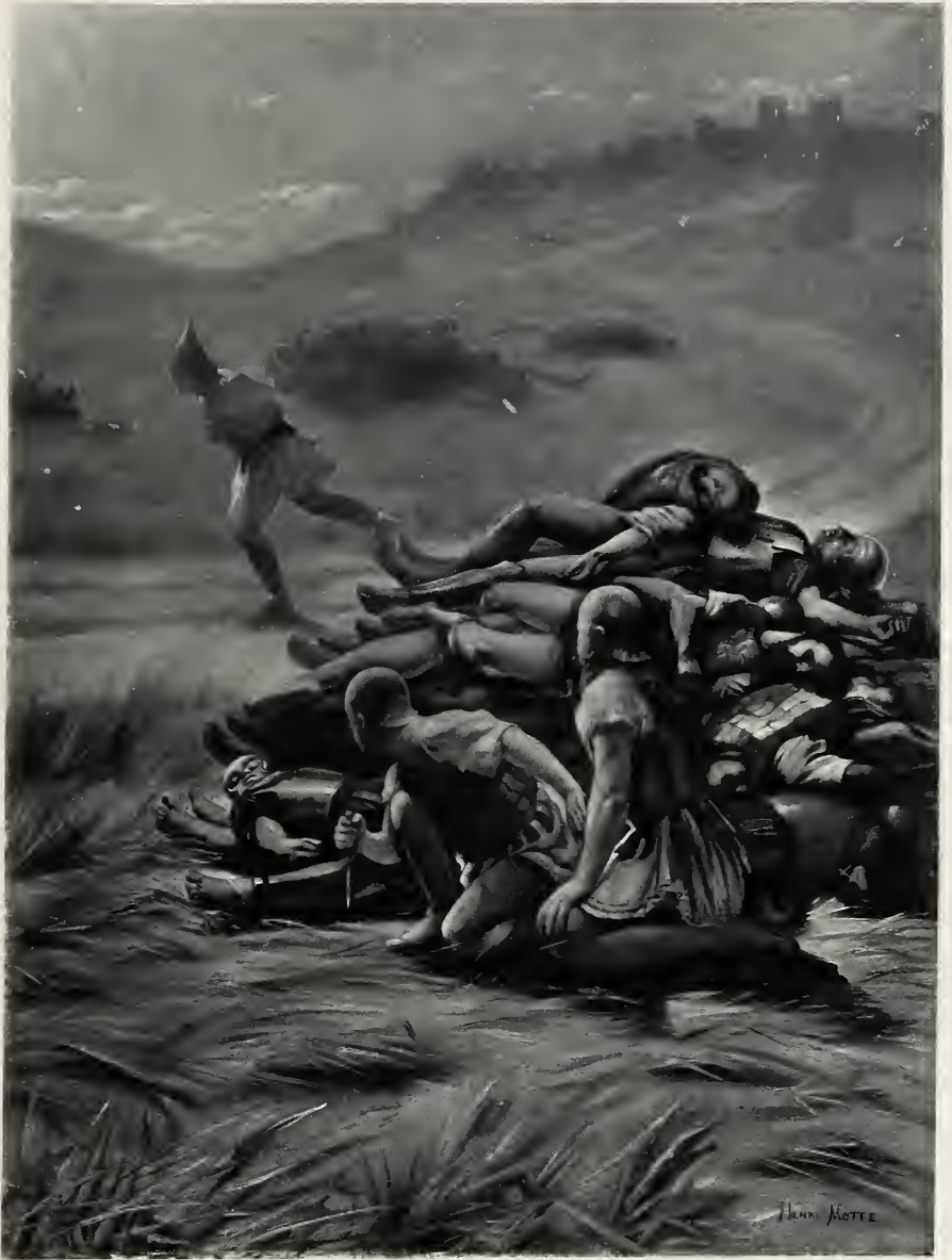
H. MOTTE INV.